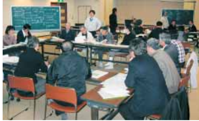
清内路自治組織設立準備会の様子

ガイドブックには、清内路の皆様に向けて、住居表示の変更に伴う手続きや、ごみの出し方、窓口の案内など阿智村の各種行政サービスや手続きなどが詳しく紹介されています。 このガイドブックは、今後清内路村で行われる説明会の資料としても使われる予定です。 また、従来から阿智村にお住まいの皆様にも、暮らしの便利帳としても活用していたいただける内容となっております。